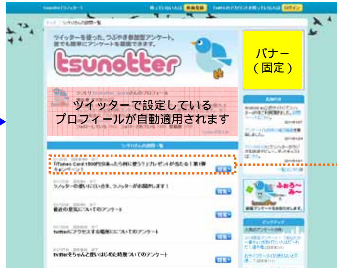
過去のアンケートが一覧できます (標準機能)