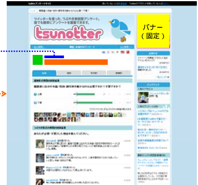
お客様専用アカウント・個別アンケートページ http://tsunotter.com/ans/*/*/*/*/